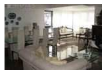
Apto. Cobertura em Salvador - BA - Bairro Pituba