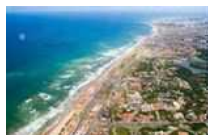
Terreno em Salvador - BA - Bairro Patamares