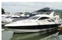
Intermarine 600 Full