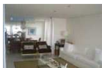
Apartamento em Salvador - BA - Bairro Ondina