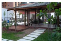
Cobertura em Alphaville I