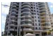
Apartamento em Salvador - BA - Bairro Itaigara