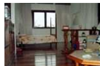
Casa em Salvador - BA - Bairro Caminho das Árvores