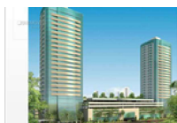
Sala comercial, Salvador-BA